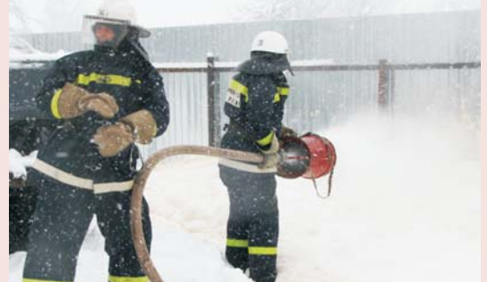
Тушение очага возгорания

заводе «Брянский Арсенал» создаётся официальное «Городское пожарное общество», которое стало членом Императорского Российского Пожарного Общества и имело собственное знамя и форму.