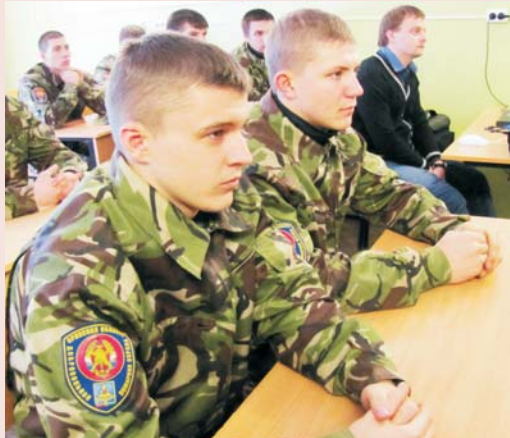
Студенты инженерно-технологического факультета на занятиях по тактике пожарного дела

Л.В. АГЕЕНКО, начальник отдела охраны труда БГСХА.