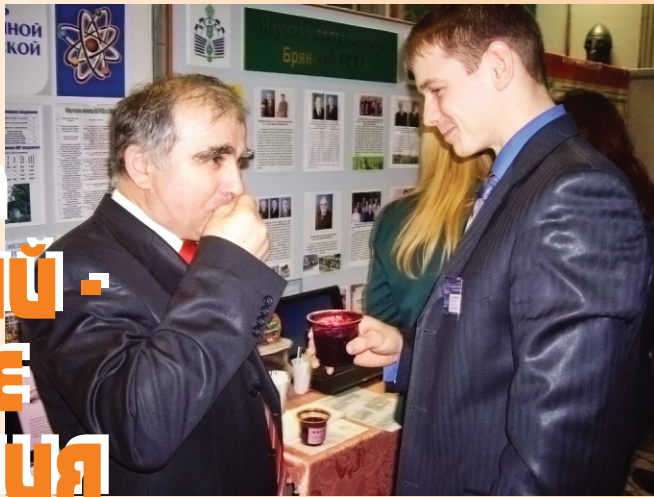
Хороши кокинские джемы...

В конце ноября в Брянске состоялся второй Славянский международный экономический форум, на котором обсуждена стратегия социально-экономического развития области, показаны преимущества её географического положения для российских и зарубежных инвесторов. В форуме приняли участие представители Смоленской, Орловской, Калужской, Липецкой, Курской, Белгородской областей центральной России; Харьковской, Житомирской, Черниговской, Сумской областей Украины; Молдовы, Словении, Польши, Болгарии, Венгрии, Латвии и Сербии. А также представители ряда министерств, ведомств и бизнес-сообществ, вузы Брянщины, в том числе БГСХА.