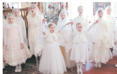
«Счастливого детства, и мирного неба, для мамы здоровья, для нищего хлеба...»

Златоуста, св. благоверного князя Олега Брянского и другими. Вдруг я ощутил, что на обычном месте не оказалось моего мобильного телефона. В храме он, естественно, был отключён, поэтому найти его было весьма проблематично. Узнав о прощанье, одна из насельниц монастыря успокоила, сказав, чтобы я подошёл к месту, где размещается церковная лавка, и спросил о пропавшем мобильнике. Так и поступил. Каково же было моё удивление, когда мой «Nokia» спокойно лежал на полочке, дожидаясь своего хозяина. Прислужница была рада, что потеря нашлась, и тихо сказала: «У нас в монастыре ничего не пропадает...».