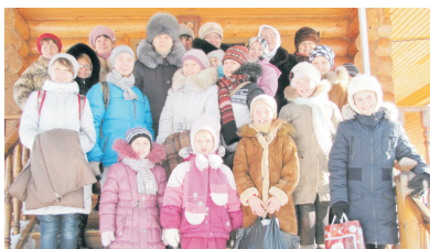
Радостные и светлые впечатления от посещения...