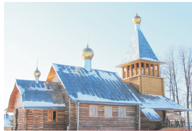
Храм в честь «Спорушницы грешных»