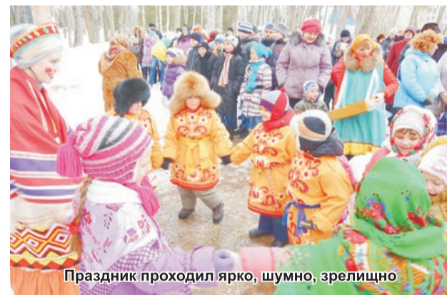
Праздник проходил ярко, шумно, зрелищно