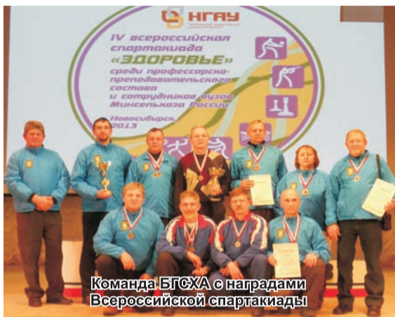
Команда БГСХА с наградами Всероссийской спартакиады

Это мероприятие состоялось в г. Новосибирске, куда приехали команды из 18 регионов страны от Санкт-Петербурга и Москвы, до Иркутска и Улан-Уде. Программа соревнований состояла из шести видов спорта: волейбол, плавание, настольный теннис, шахматы, дартс, стрельба из пневматической винтовки.