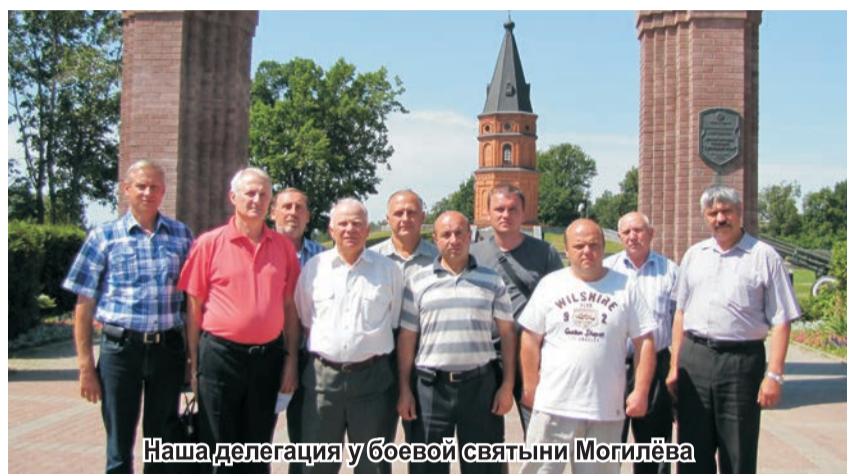
Наша делегация у боевой святыни Могилёва

Характерная особенность состоит в том, что в вузе широко развиты физкультура и спорт. С раннего утра и до позднего вечера стадион с искусственным полем, что называется, работает на здоровье. Студенты играют в футбол, волейбол, баскетбол, легкоатлетические дорожки тоже не пустуют. Так и кажется, что именно здесь сосре-