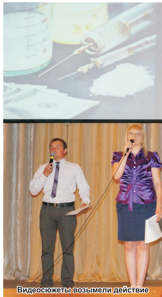
Видеосюжеты возымели действие

ПРЕСС-ЦЕНТР БГСХА.