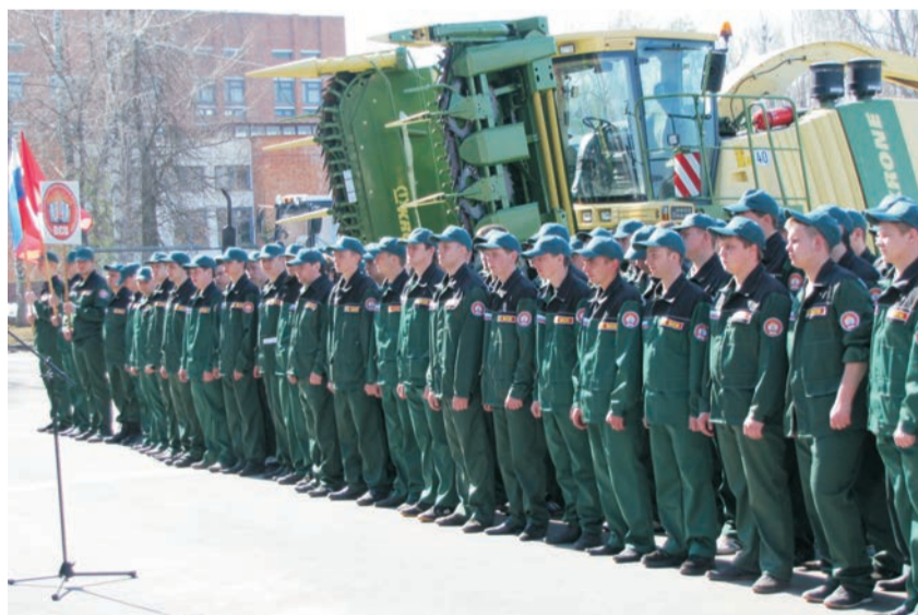
Торжественные проводы механизированного отряда «Русич» Брянской ГСХА