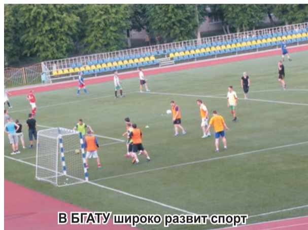
В БГАТУ широко развит спорт