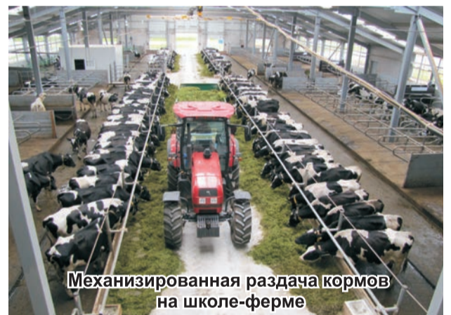
Механизированная раздача кормов на школе-ферме