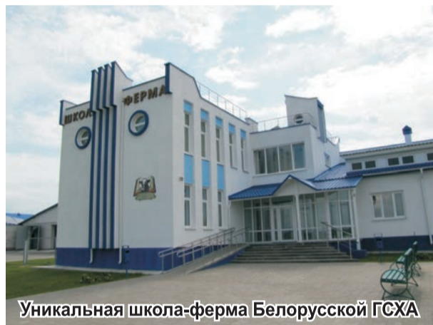
Уникальная школа-ферма Белорусской ГСХА