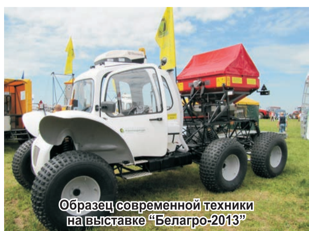
Образец современной техники на выставке «Белагро-2013»

В своём путевом дневнике, который я вёл на протяжении всего времени пребывания в соседней стране, записал такие строки, навеянные яркими впечатлениями. «Никак не ожидал увидеть подобное. Безудержное восхищение вызывает строительство дорог. Такого масштабного действия (именно действия) я не видел давно». Действительно на протяжении нескольких сот километров, когда мы ехали по трассе через Гомельскую, Могилёвскую области, вплоть до самого Минска, велось грандиозное дорожное строительство. В своём дневнике его, то есть дорожное строительство, я обозначил, как невиданное доселе. То с левой, то с правой стороны мы видели насыпи с глиной, песком и гравием, мощную технику – бульдозеры, тракторы, грузовики, асфальтоукладчики, и, конечно же, люди, благодаря труду которых всё это превращалось в реальную многокилометровую трассу европейского уровня. Как потом удалось выяснить, в Беларуси существует, точнее, действует государственная программа, которая нацелена на создание дорог первой категории ко всем областным центрам республики. Причем, дороги строятся в обход населённых пунктов. Это оставляет громадное впечатление, и безгранично радуешься за братьев-белоруссов, умеющих не на словах, а на деле воплощать в реальность свои идеи, предусмотренные государственными программами. Одна из них видна налицо – хорошие дороги.