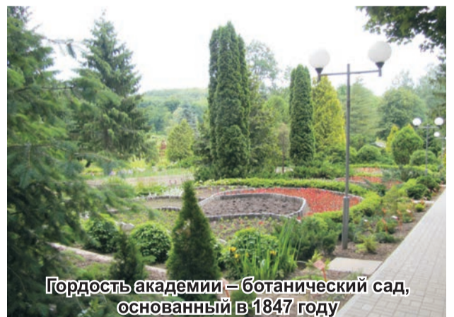
Гордость академии – ботанический сад, основанный в 1847 году