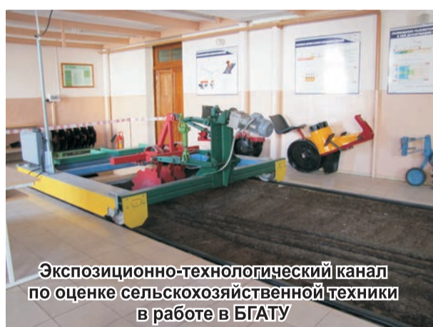
Экспозиционно-технологический канал по оценке сельскохозяйственной техники в работе в БГАТУ