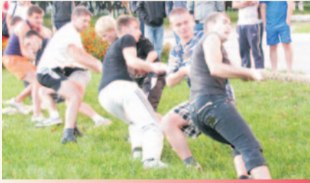
Ещё раз взяли!

Парни и девушки с энтузиазмом соревновались в различных видах. Им приходилось не только совершать бег на определённую дистанцию, что было обычным явлением, но и бежать с огнетушителем, пользоваться противогололёдным средством, переносить «пострадавшего» на носилках,