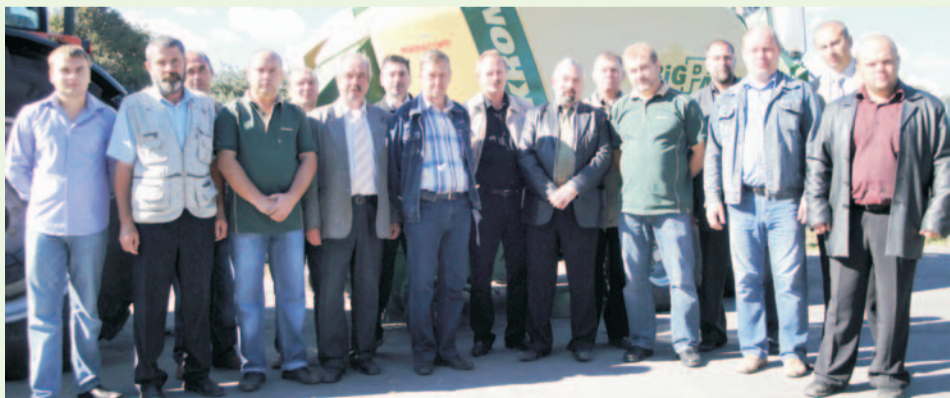
Участники специализированного семинара

В.К. МЕКТО.