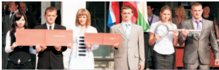
Новое поколение студентов академии