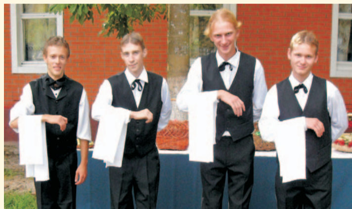
Студенческий театр фольклора «Глаголи» в образе половых