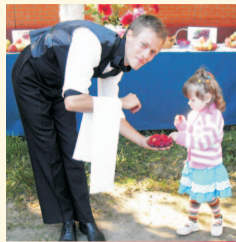
Кокинской чудо-ягодой малиной угощались от мала до велика

Словом, мы побывали на большом празднике, который оставил немало яр-