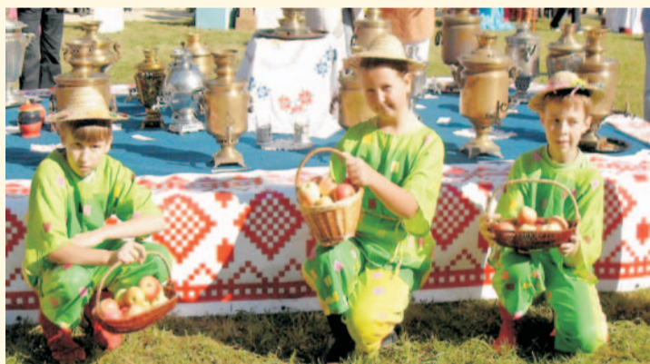
Детский театральный коллектив «Балагуры», состоящий из учащихся Кокинской школы