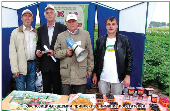
Экспозиция академии привлекла внимание посетителей

28%, среднеспелые – 17% и среднепоздние и поздние – 14%. Подобная структура сортов позволяет товаропроизводителям организовать выращивание этой культуры наиболее оптимально. При этом начать с середины июля вести массовую уборку,