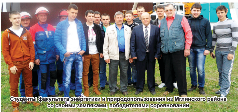
Студенты факультета энергетики и природопользования из Мглинского района со своими земляками, победителями соревнований