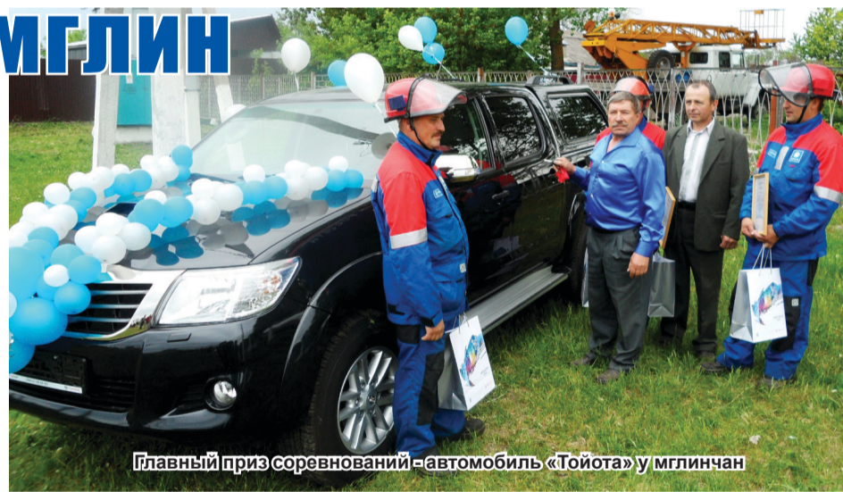
Главный приз соревнований – автомобиль «Тойота» у мглинчан

Как видно, участники состязаний демонстрировали знания и умения по различным направлениям своей профессиональной деятельности. К тому же, что немало важно, условия, в которых проходило мероприятие, были максимально приближены к реальным. В упорной борьбе победа досталась бригаде Мглинских районных электрических сетей