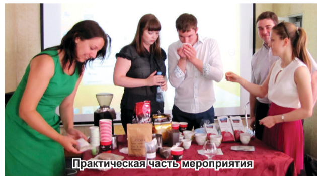
Практическая часть мероприятия

из теоретической и практической частей. Вначале была обстоятельная презентация, которая затронула вопросы технологии создания кофейных плантаций, влияния условий произрастания на качество кофейных зёрен, новых видов кофейного сырья, технологии обжарки и варки кофе.