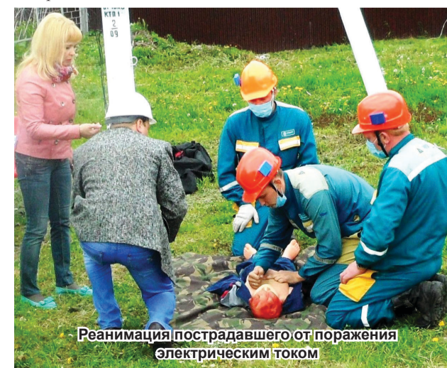
Реанимация пострадавшего от поражения электрическим током

Л.М. МАРКАРЯНЦ, зав. кафедрой систем энергообеспечения БГСХА.