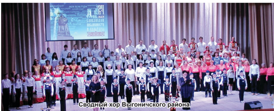
Сводный хор Выгоничского района

РЕКТОРАТ, ПРЕПОДАВАТЕЛИ, СОТРУДНИКИ И СТУДЕНТЫ БГСХА.