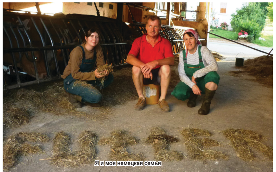
Я и моя немецкая семья

Работа в сельском хозяйстве очень тяжёлая, и мне было жалко мою