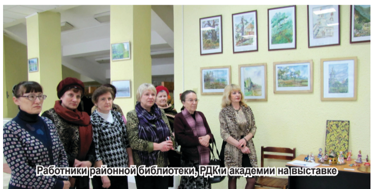
Работники районной библиотеки, РДК и академии на выставке

Сегодня, в день прекрасный юбилей, Мы от души хотим вам пожелать, Чтоб о годах прошедших не жалея, Вы продолжали верить и мечтать. Здоровья вам, добра и оптимизма, Удачи и счастливых дней, Пусть будет всё благополучно в жизни У вас, и ваших близких, и друзей! РЕКТОРАТ, ПРЕПОДАВАТЕЛИ, СОТРУДНИКИ И СТУДЕНТЫ БГСХА.