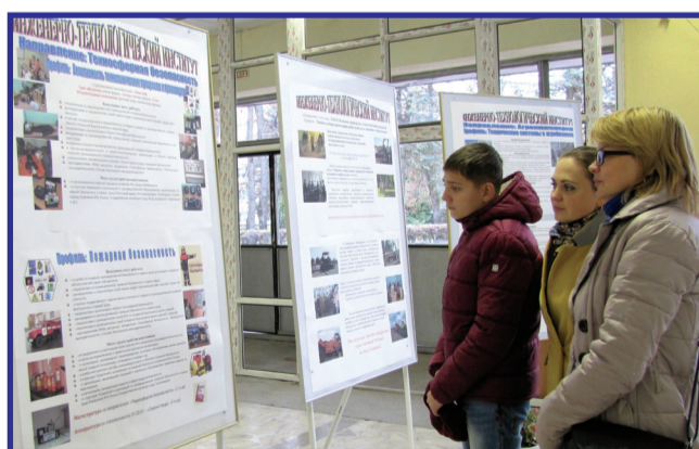
Инженерно-технологический институт представил пять своих стендов

Когда гости расположились в актовом зале, им была представлена концерт-