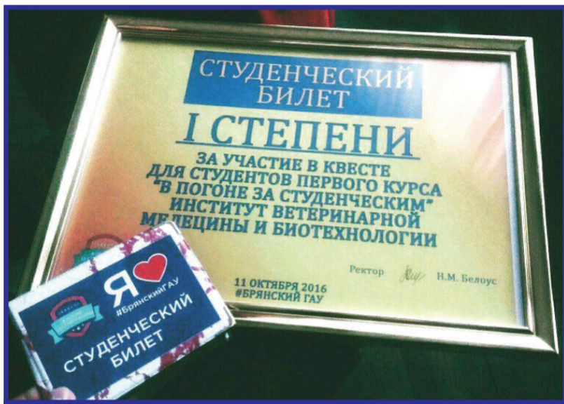
Тот самый Диплом с ошибкой

Очередной приход первокурсников (новобранцев) в наш университет был ознаменован инновацией под названием «Квест». Я не принадлежу к тем, кто всецело поддерживает это «инновационное» начинание, так называемую игру, а тем более её название. Но, если молодёжи это нравится, то пусть, как говорится, поиграет: чем бы дитя ни тешилось, лишь бы не плакало.