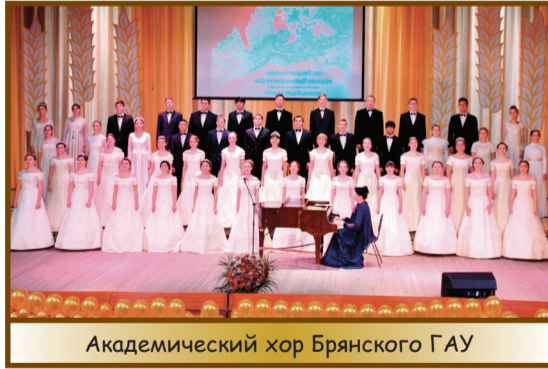
Академический хор Брянского ГАУ

ПРЕСС-ЦЕНТР БРЯНСКОГО ГАУ.