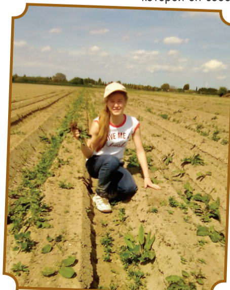
На прополке моркови