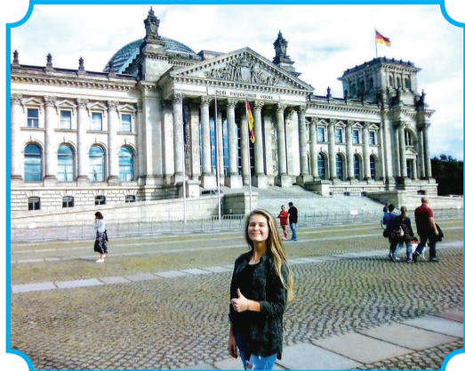
У Рейхстага в Берлине

После семинара оставалось ещё два выходных для того, чтобы отправиться в путешествие в другие города. Я и другие практиканты посетили Мюнхен, полюбовались всемирно известной Альянс Ареной, увидели прекрасную Ратушу, музей BMW, а также совершили прогулку по таинственным улочкам прекрасного Дрездена.