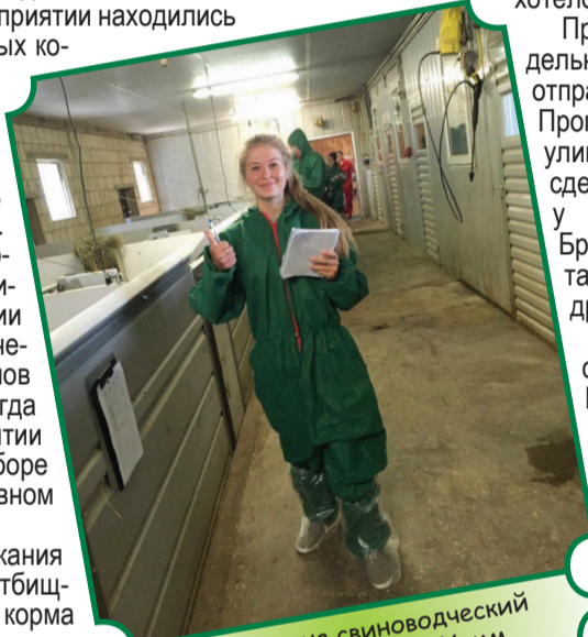
Экскурсия на свиноводческий комплекс в городе Хамм