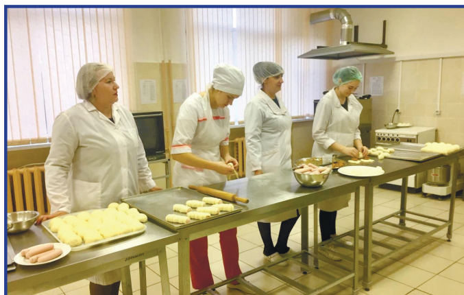
Мастер-класс по выпечке мелкоштучных хлебулочных изделий