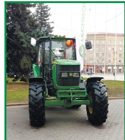
Трактор John Deere, который получил Брянский ГАУ

До начала официальной части мероприятия руководители области ознакомились с представленной на выставке продукцией сельского хозяйства и перераба-