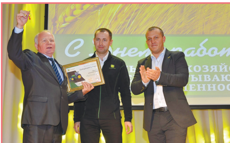
Сертификат и ключи от трактора John Deere вручены Брянскому ГАУ

Александр Резунов, который, в частности, отметил, что сегодня в этом зале собрались лучшие представители трудовых коллективов, гордость всей отрасли АПК – люди, на которых держится большая часть экономики региона. И это не просто красивые слова, за ними весьма внушительные цифры и показатели. Вице-губернатор привёл немало цифр, которые