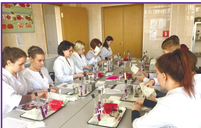
Микробиологический контроль санитарно-гигиенического состояния производства