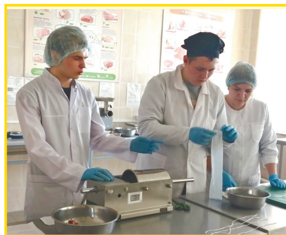
Мастер-класс по производству варёно-копчёной колбасы «Московская»