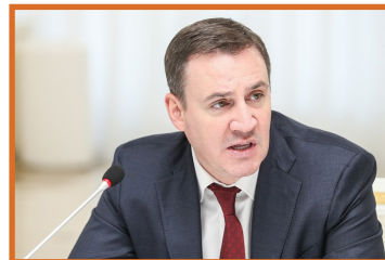
Выступает министр сельского хозяйства Российской Федерации Дмитрий Патрушев

По мнению министра, государство многое делает для позитивных изменений в сфере аграрного образования. В текущем году на поддержку выделено 28,3 млрд рублей – почти на 1,5 млрд больше, чем в прошлом году. Обновляется материально-техническая база, внедряются новые образовательные методики, повышается профессиональный уровень преподавателей. Это делает процесс получения знаний всё более эффективным, что положительно сказывается на престиже аграрных специальностей. Среди основных итогов работы аграрных ВУЗов в 2019 году отмечалось повышение научной активности, рост числа иностранных студентов и увеличение доли обучающихся