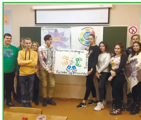
Классный час к международному дню толерантности