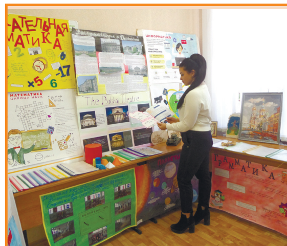
Выставка творческих работ студентов