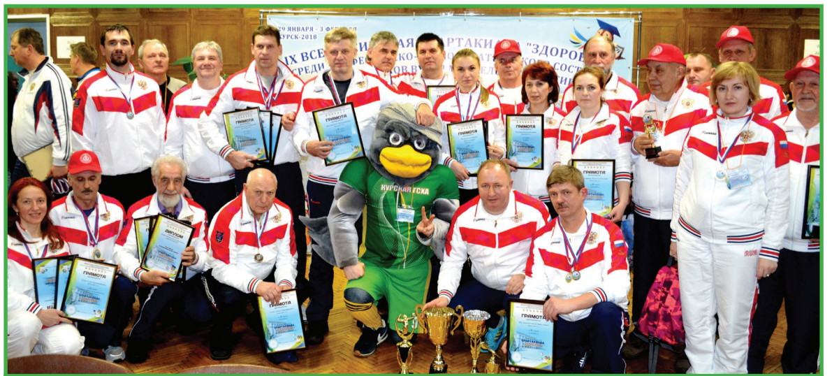
Команда Брянского ГАУ на спартакиаде в Курске

Виктор МЕКТО.