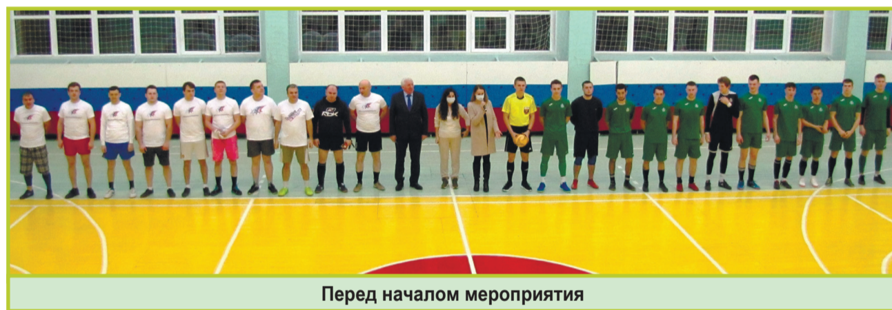
Перед началом мероприятия