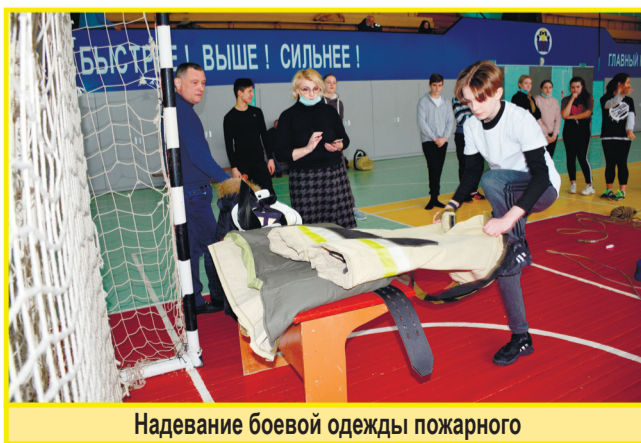
Надевание боевой одежды пожарного