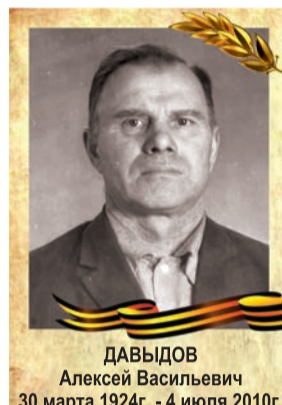
ДАВЫДОВ Алексей Васильевич 30 марта 1924г. - 4 июля 2010г.

Я не знаю, что такое война, беда, голод. Зато все тяготы и лишения войны прошли, пережили мои предки.