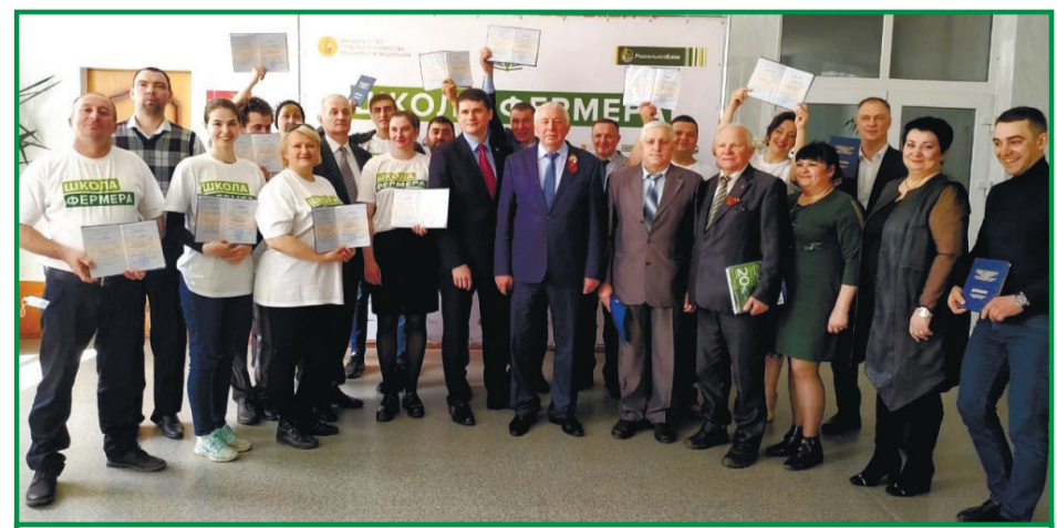
Выпускники «Школы фермера» получили дипломы