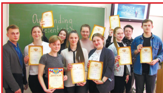
Студенты получили соответствующие дипломы конкурса

Для кафедры иностранных языков Брянского ГАУ уже давно стало традицией проведение конкурса компьютерных презентаций среди студентов 1-2 курсов бакалавриата и магистратуры. Недавно подобное мероприятие состоялось на тему «Выдающиеся учёные».