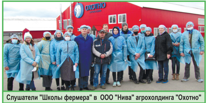
Слушатели "Школы фермера" в ООО "Нива" агрохолдинга "Охотно"

Слушатели «Школы фермера» смогли вочию увидеть животноводческий комплекс (племенной репродуктор) Европейского уровня, где практически все производственные процессы механизированы, даже «подборку» кормов выполняет специальный робот. Гости посмотрели комфортные условия, в которых содержатся коровы и молодняк животных. Посетили доильный зал «Карусель» на 50 скотомест, представляющий конвейерную систему производства молока. А общение со специалистами позволило слушателям обогатить свой профессиональный опыт.