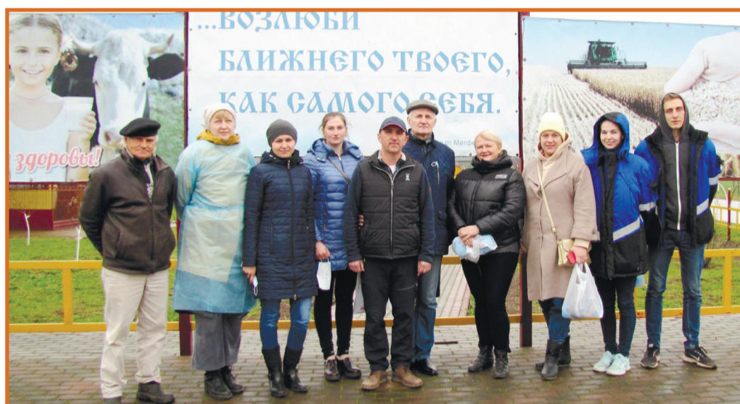
Слушатели «Школы фермера» в СПК «Зимницкий» Дубровского района