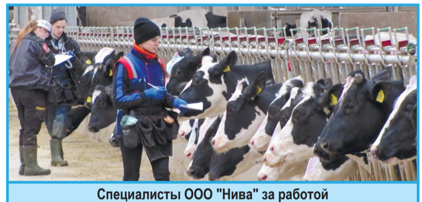
Специалисты ООО "Нива" за работой