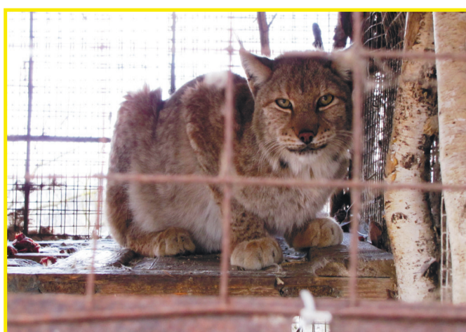
Экзотика - ещё одно пристрастие фермера