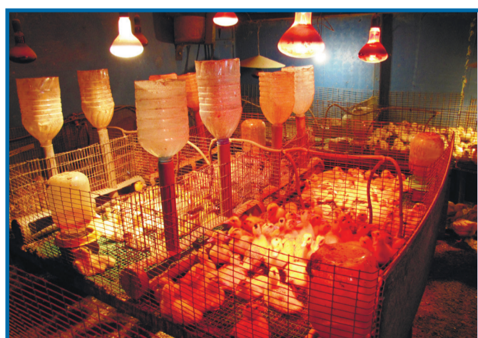
Искусственное солнце для утят