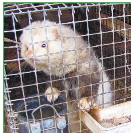
Звероводство - одно из направлений хозяйства