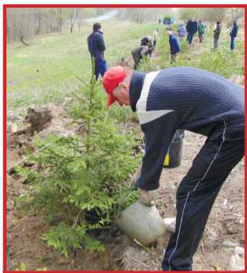
Полив елям необходим, как воздух человеку