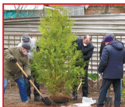
Работа спорилась на посадке туй