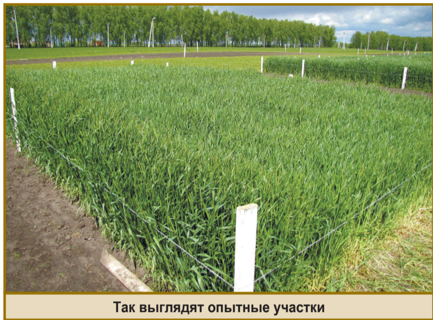
Так выглядят опытные участки

всей России свои достижения и, конечно, поделиться опытом. В рамках Дня поля традиционно демонстрируются лучшие образцы сельскохозяйственного машиностроения и передовые технологии растениеводства, животноводства и перерабатывающей отрасли.