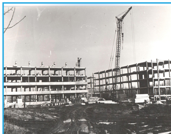
Быстро росли корпуса будущего ВУЗа