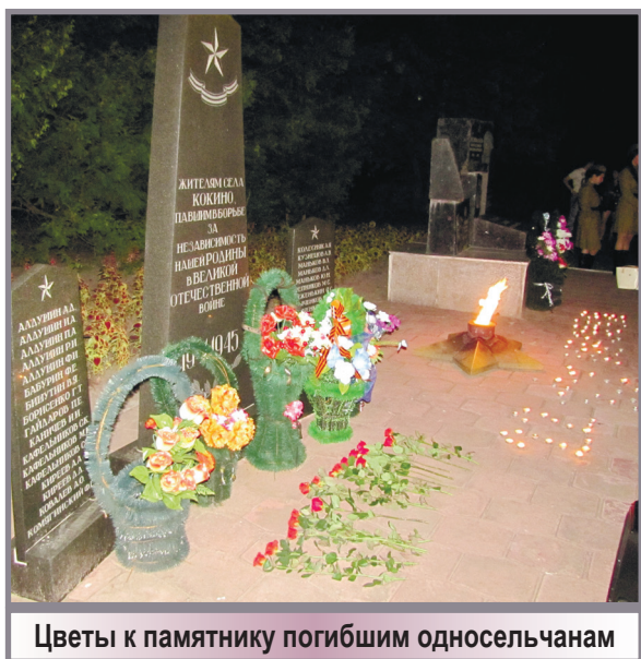
Цветы к памятнику погибшим односельчанам