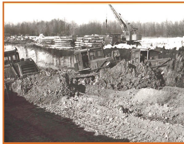
Так начиналась стройка

Виктор МЕКТО.