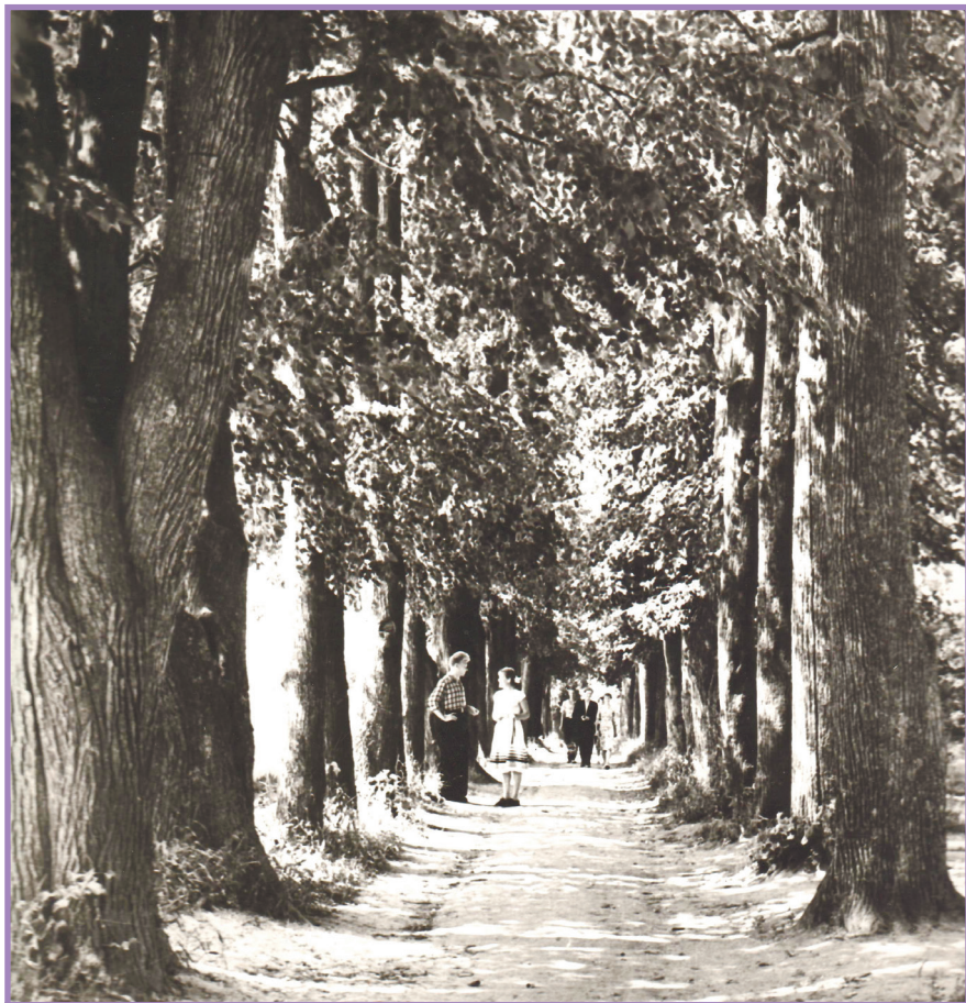
Кокинские аллеи помнят многое и многих