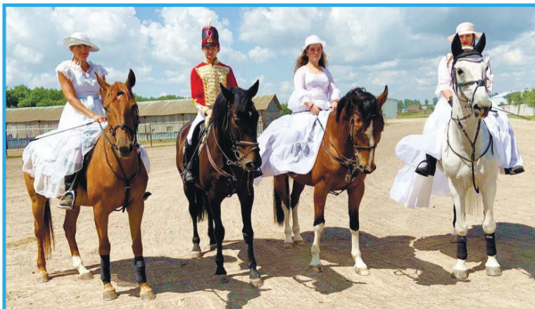
Показательное выступление конноспортивной секции Брянского ГАУ

В выступлениях Губернатора и почётных гостей праздника красной нитью воспроизводились слова о том, что наш на-