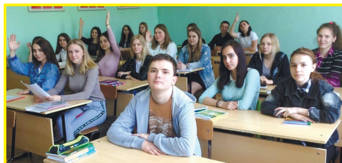
Студенты проявили высокий интерес

тему рассказывалось о невероятных испытаниях, которые выпали на долю детей, подростков, юношей и девушек. Они наравне с взрослыми дежурили на чердаках и крышах домов, гасили зажигательные бомбы и пожары, принимали участие в строительстве оборонительных рубежей, уходили на фронт, в партизанские отряды, вели борьбу с фашистами. Студенты вспомнили имена многих юных героев Советского Союза: Марат Казей, белорусский юный красный партизан-разведчик; Валентин Котик, самый молодой Герой Советского Союза – на момент гибели ему едва исполнилось 14 лет; Володя Дубинин, разведчик в партизанском отряде города Керчи, точно мог запомнить численность нескольких вражеских подразделений, находящихся в разных местах; Зина Портнова, член подпольной организации «Юные мстители», разведчица