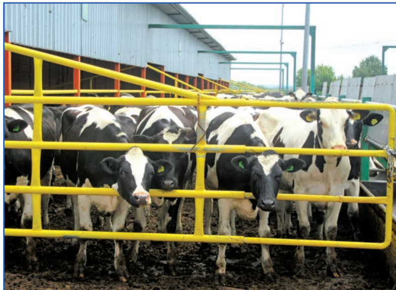
Вот такие в хозяйстве породистые красавицы!

«Железнодорожник» является дочерним предприятием Брянского молочного комбината детского питания, известного во всей России под торговой маркой «Ам-Ам». Десять лет назад проблемой для этого предприятия было формирование сырьевой базы для переработки. И тогда, генеральному директору