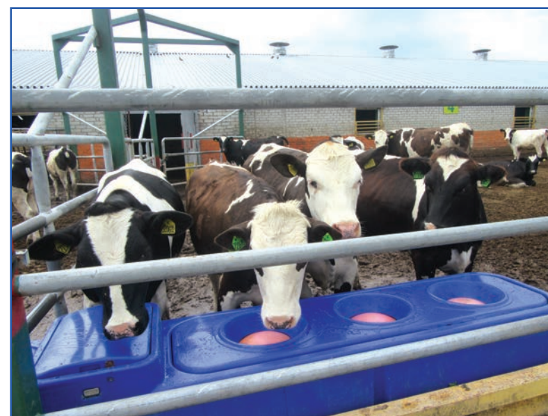
Коровники оборудованы современными поилками