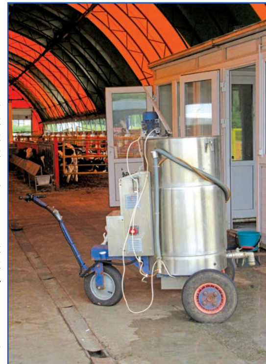
«Молочное такси» для выпаживания телят