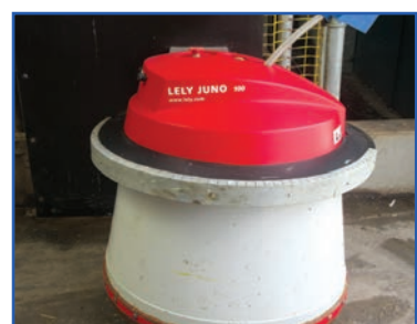
Этот робот вместо скотника подталкивает корм ближе к коровам

В течение длительного периода своего развития в хозяйстве были осуществлены коренные изменения в системе производства кормов для животных. Была осуществлена закупка племенного скота в основном из племенного завода «Новый путь» Брянского района, а также из племенных хозяйств Калужской области. С