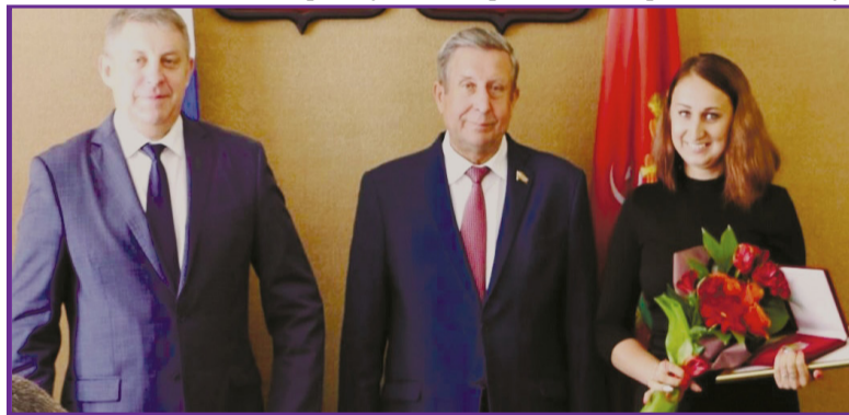
Вручение памятной медали и грамоты Президента России

Он также отметил, что участие в таком знаменитом и важном мероприятии придаст новый импульс достижениям ребят в творчестве, образовании, нау-