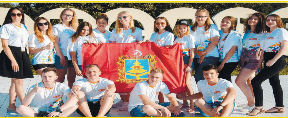
Студенты Брянских ВУЗов на форуме