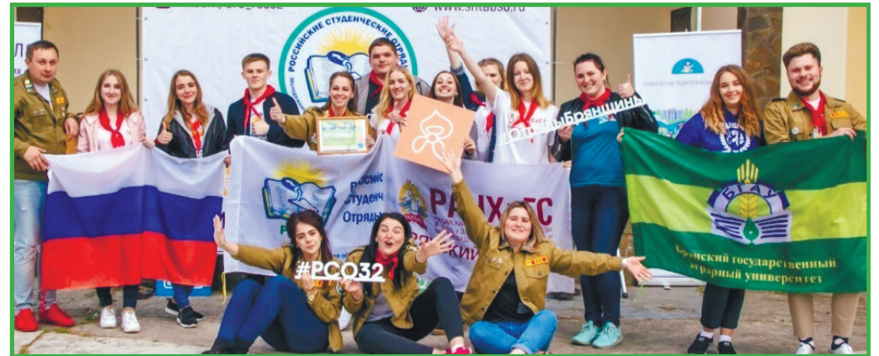
Студенты Брянского ГАУ - участники мероприятия