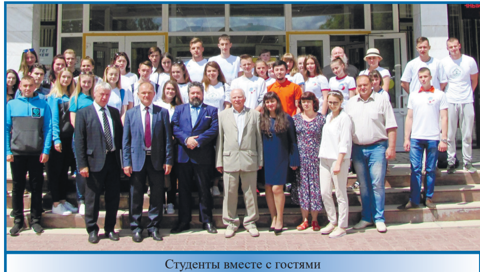
Студенты вместе с гостями