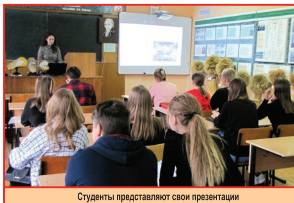
Студенты представляют свои презентации