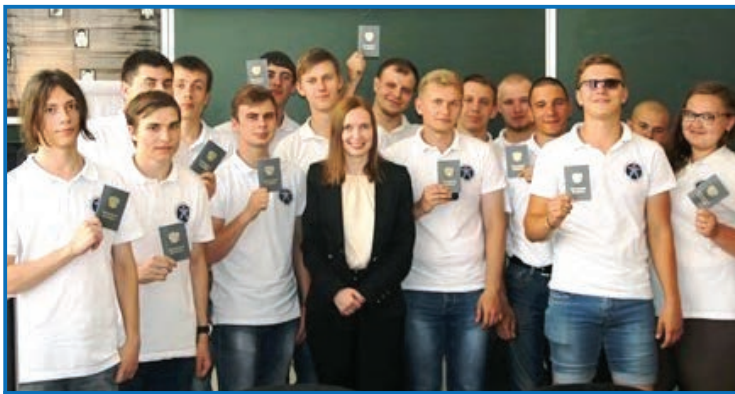
Студотрядовцы получили трудовые книжки

Работа на энергообъектах для студентов стройотряда – это реальная возможность проверить свои знания на практике и убедиться в правильности выбора профессии. В процессе совместной работы с опытными специалистами студенты приобретают