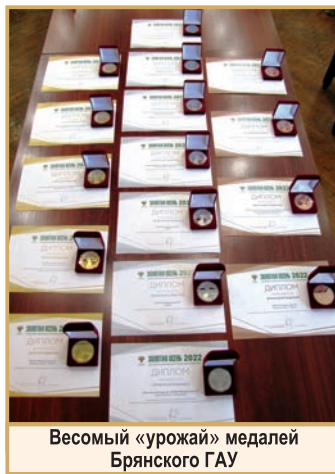
Весомый «урожай» медалей Брянского ГАУ

Свою продукцию на главной деловой площадке российского АПК представили ведущие предприятия