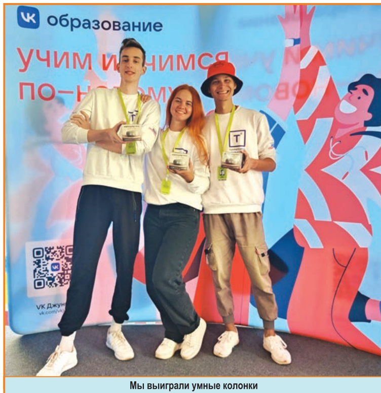
Мы выиграли умные колонки