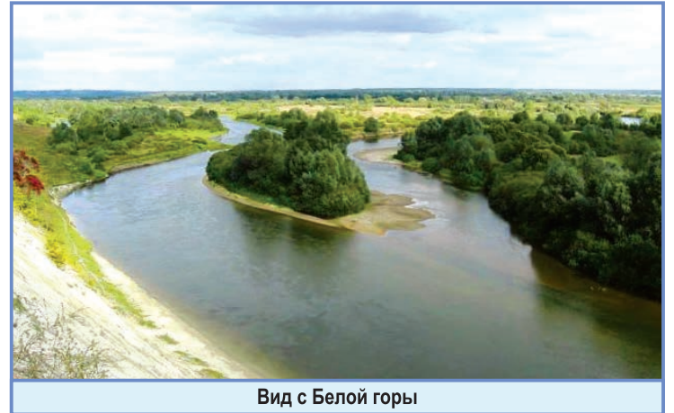
Вид с Белой горы

Ярко и весело цветёт Белая гора, но остановившись вблизи дома, в прохладной тени ракиты, возле устья реки Уж можно любоваться растениями-неженками, которые не всегда предпочитают яркие солнечные лучи и прячут свои листья под пологом крон деревьев. Это чистотел, сныть, бешеные огурцы, аромат которых наиболее приятен во время цветения. Чистотел в переводе с греческого означает «ласточка» или «небесный дар». Это имя дано растению не случайно, древние с особым почтением относились к ласточке, считали её символом весны. Ведь с цветением этой травы совпадает прилёт ласточек и выведение птенцов.