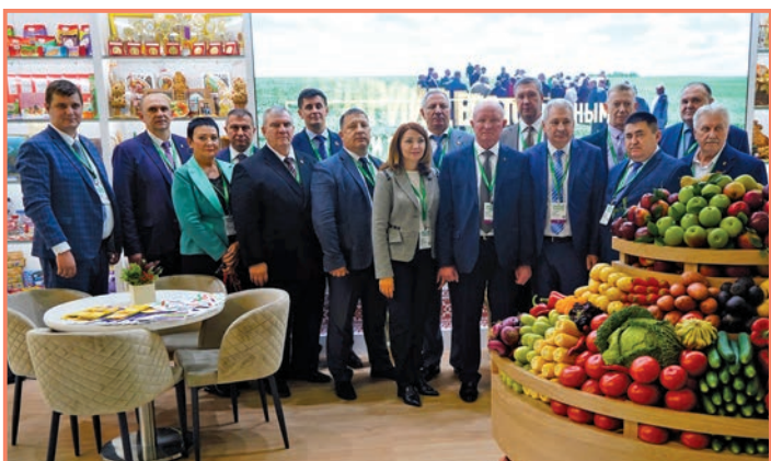
Врио ректора Брянского ГАУ Сергей Сычѳев в составе делегации Брянской области на Российской выставке «Золотая осень - 2022»