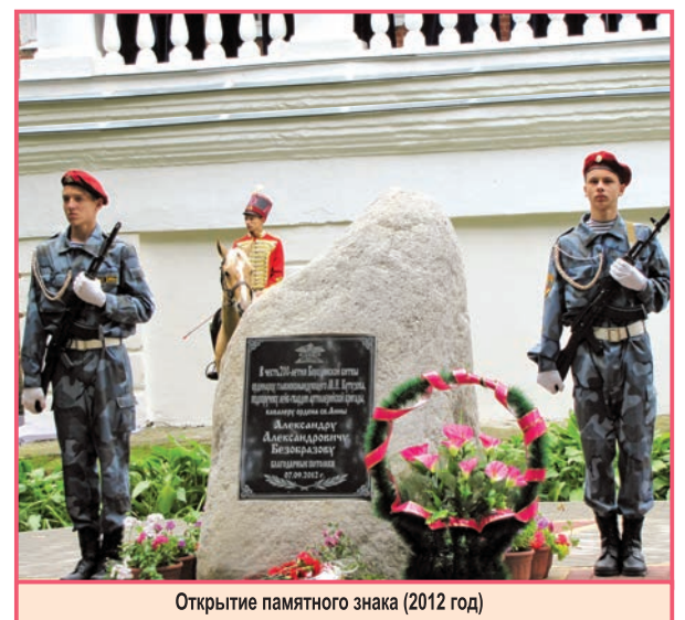
Открытие памятного знака (2012 год)