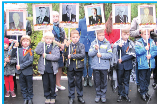
Бессмертный полк всегда в строю