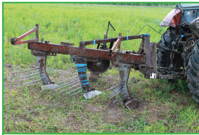
Экспериментальный плуг (ТРКН-3-35)