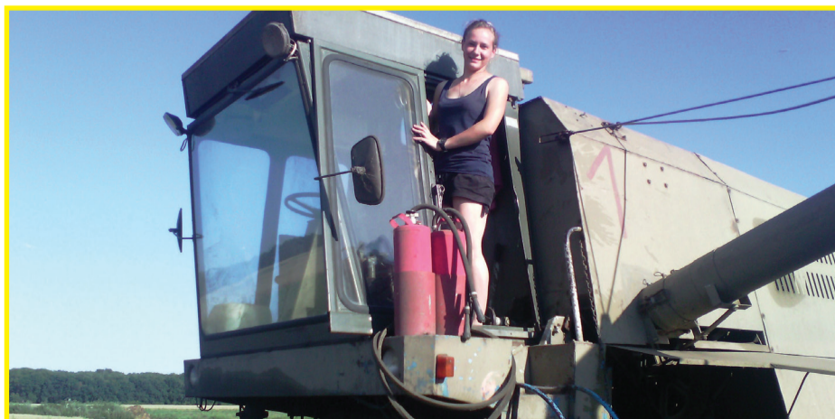
Работа на уборочном комбайне мне тоже по плечу