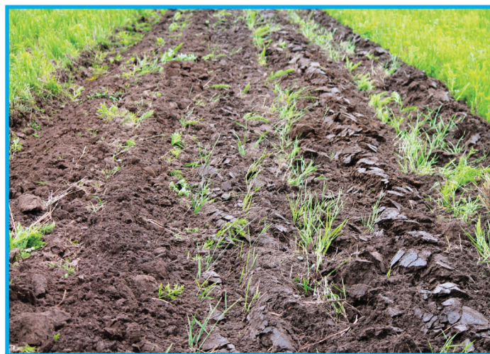
Слева обработано экспериментальным плугом, справа – традиционно