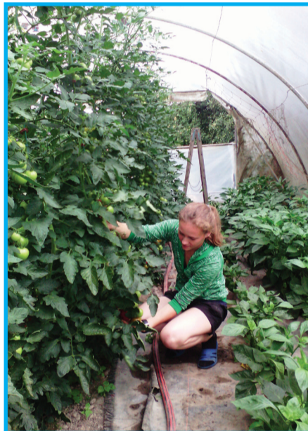
Работа в теплице