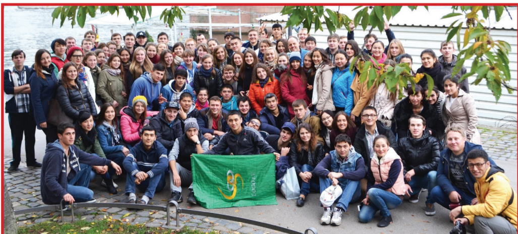
Более 120 студентов из разных стран встретились в Германии