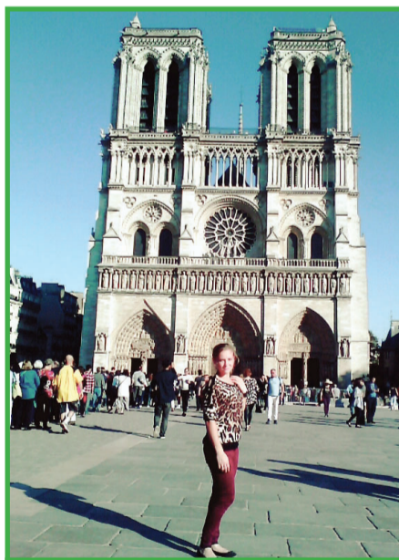
Путешествие по Европе