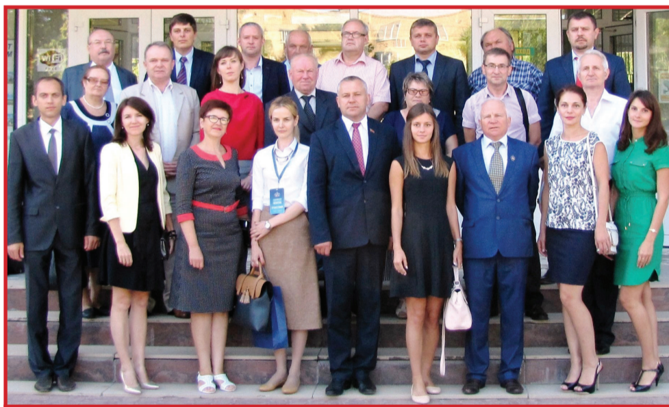
Участники мероприятия у главного корпуса ВУЗа

В рамках V Славянского экономического форума на базе нашего университета состоялась секция «Производство отечественной