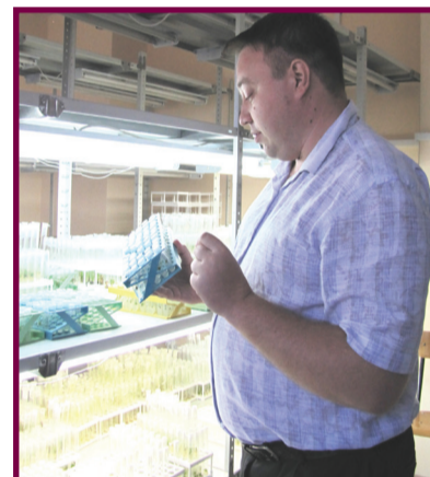
Из пробирики начинается урожай