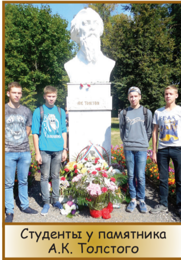
Студенты у памятника А.К. Толстого

«Край ты мой, родимый край, Конский бег на воле, В небе крик орлиных стай, Волчий голос в поле! Гой ты, родина моя!