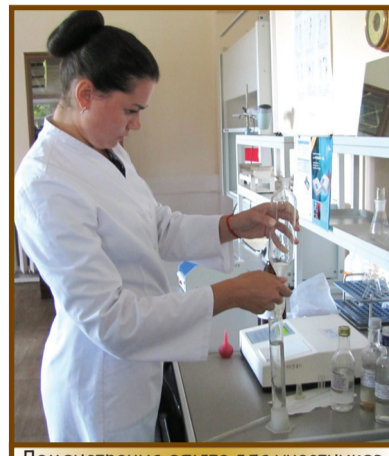
Демонстрация опыта для участников тематической секции

Не обошли вниманием участники дискуссионной площадки и меры по реализации научно-технической политики в интересах развития сельского хозяйства. Живой интерес