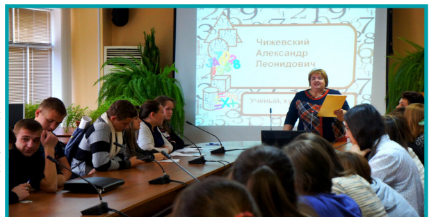
Студенты знакомятся с творчеством А.Л. Чижевского