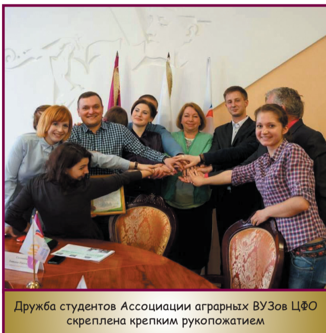
Дружба студентов Ассоциации аграрных ВУЗов ЦФО скреплена крепким рукопожатием

Для участников форума была проведена экскурсия по Курску, где ребята познакомились с историей и достопримечательностями города. Также в честь 70-летия Победы в