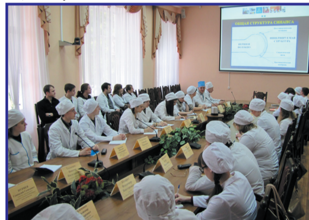
Студенты БГАУ знакомятся с передовыми технологиями

И.В. МАЛЯВКО , директор института ветеринарной медицины и биотехнологии БГАУ.