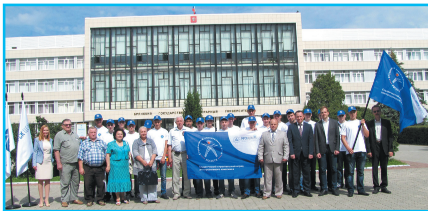
Торжественные проводы студенческого строительного отряда

на производственных площадках ОАО «МРСК Центра»