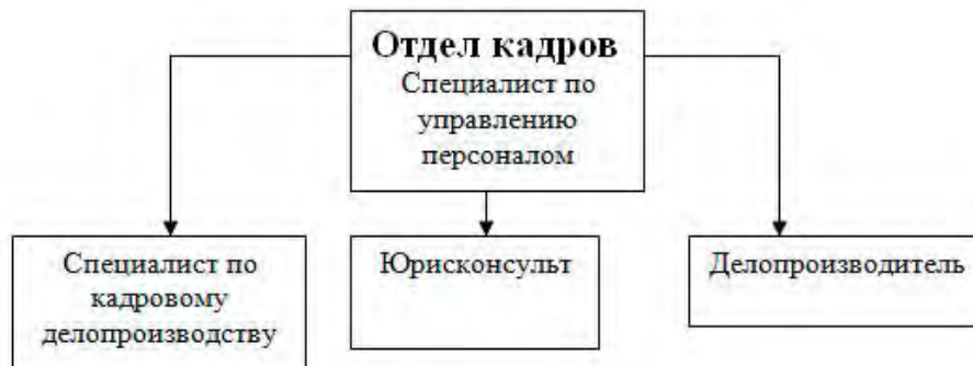
Рисунок 5. – Организационная структура отдела кадров

Подпись всегда начинают с прописной буквы. В конце подписи точки не ставят. Размещают ее под рисунком, например: