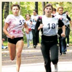
Студентки на дистанции 500 м.

С.И. РОГАНКОВ, заведующий кафедрой физической культуры и спорта БГСХА.