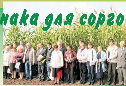
Участники конференции на опытном поле академии