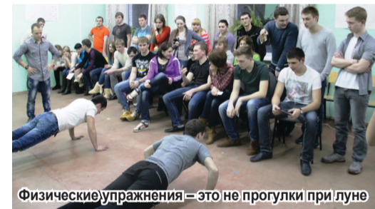
Физические упражнения – это не прогулки при луне