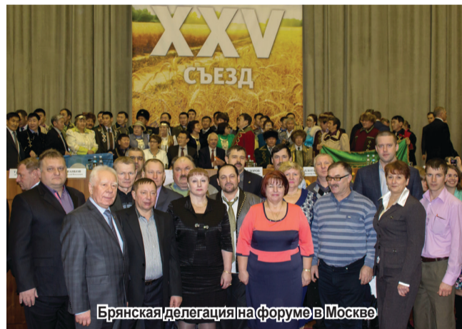
Брянская делегация на форуме в Москве

Не менее значимой является роль фермерских хозяйств в социально-территориальном развитии села. Прежде