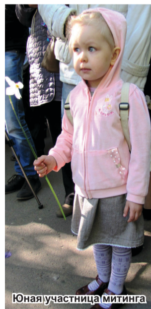
Юная участница митинга

Совета ветеранов нашего ВУЗа, на протяжении многих десятилетий принимающих самое живое участие в жизни академии. Спасибо за вашу активную гражданскую позицию, вашу поддержку наших начинаний и