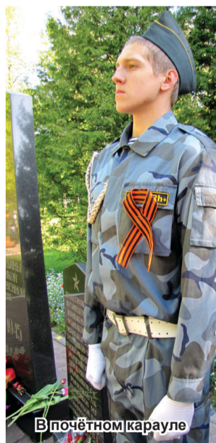
В почётном карауле

В борьбе с фашизмом подлинным творцом Победы стал весь советский народ. Великий подвиг совершили труженики тыла. Преодолевая неимоверные лишения, они выиграли трудную битву за мирное небо, за счастье своих детей, внуков и правнуков, за сильную и гор-