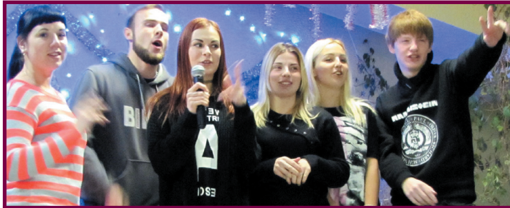
Брянский ГАУ - лучший ВУЗ на свете