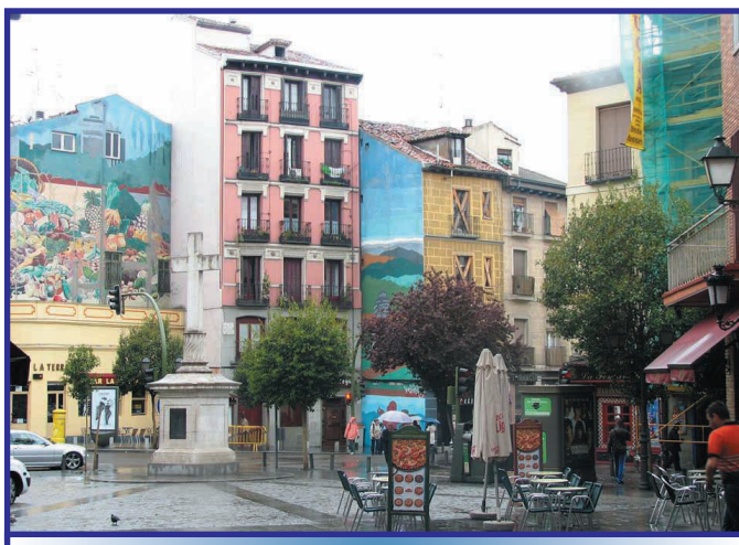
Один из кварталов столицы Испании

Ещё разочаровывает маленькое незрелое по сравнению с московским метро. Но в нём на стенах вагонов можно прочитать стихи испанских поэтов и пахнет освежителями воздуха. На улицах, в скверах всегда гуляет много людей, даже если это не выходные, причём гуляют не только молодёжь, но и взрослые, даже пожилые, парами, держась за руки. Пожилые, почти на ладан дышащие пары, но которые при этом хорошо одеты, женщины с укладкой и маникюром, а мужчины обязательно в костюме – это ещё одна деталь, которая поразила меня в городе. При этом они не впадают в ступор, не доживают, а реально живут и наслаждаются жизнью. Улыбаются, пьют кофе или