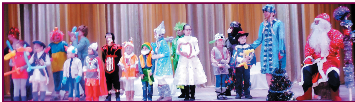
Парад карнавальных костюмов на главной сцене университета