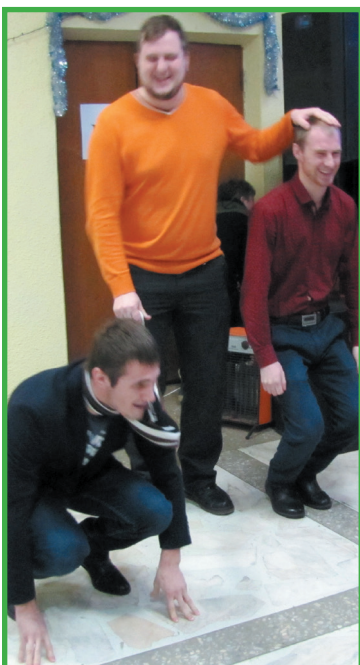
Хозяин со своими питомцами