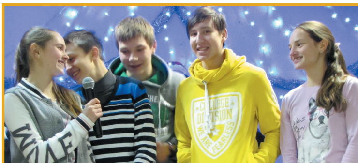
Команда новичок, чок, чёк...