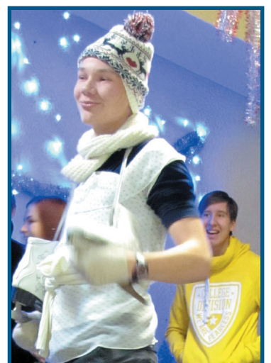
Мой праздничный наряд