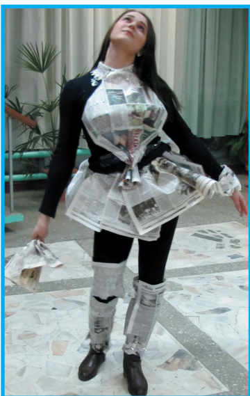
Я такая вся застенчивая...