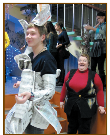
Газетное платье короля