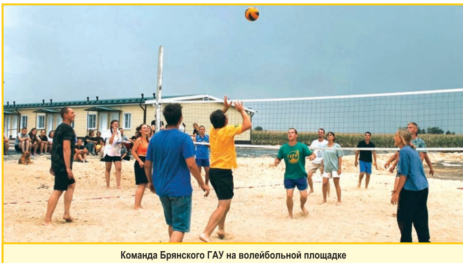
Команда Брянского ГАУ на волейбольной площадке