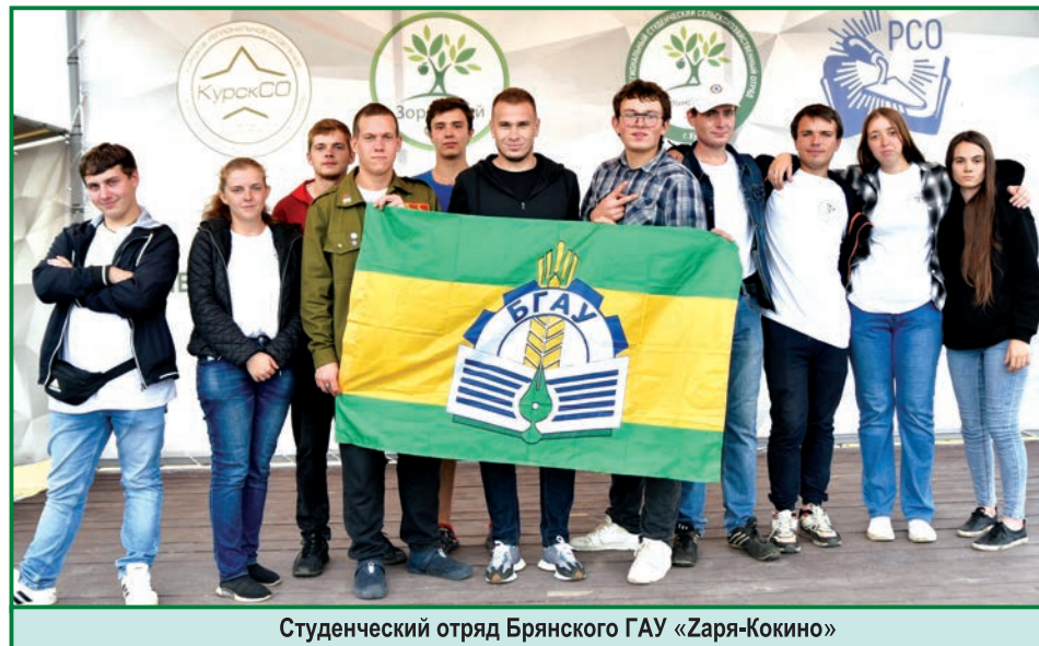
Студенческий отряд Брянского ГАУ «Заря-Кокино»

целое море – 600 гектаров. С одним стройотрядом из Кокино мало что сделаешь. Вот почему подобных