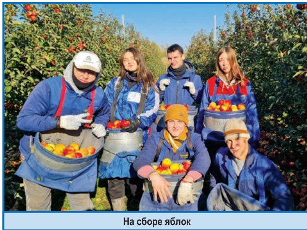
На сборе яблок

Вставали в 8 утра. Делали зарядку, завтракали и в путь – на сбор яблок. Однако снимать яблоки начинали в сентябре. А в августе ставили скобы, убирали мусор, выполняли другие неотложные работы. Ведь яблоневый сад в Обоянском районе Курской области – это