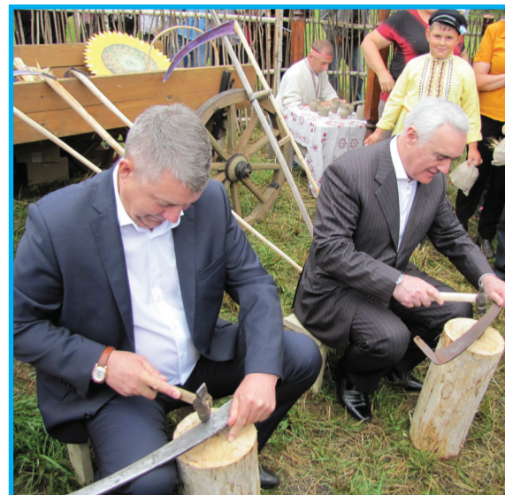
Александр Богомаз и Мурат Зязиков отбивают косы