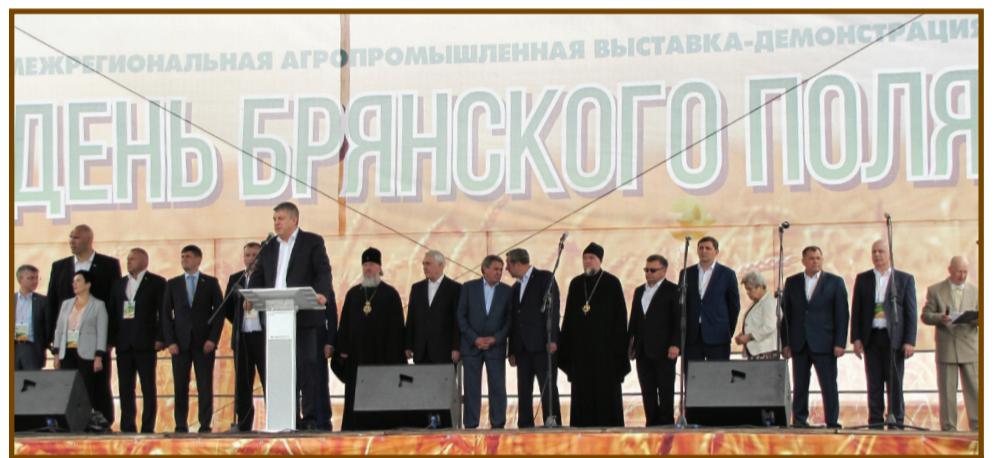
Официальную часть праздник открыл Губернатор Брянской области Александр Богомаз

На сельскохозяйственной площадке Выгоничского муниципального района участники мероприятия увидели