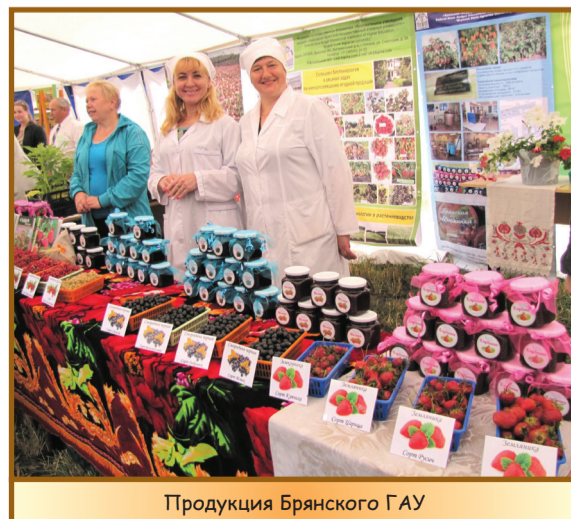
Продукция Брянского ГАУ