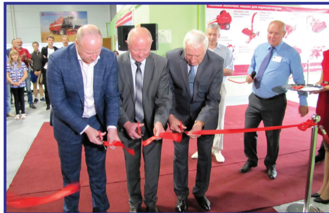
Торжественный момент открытия учебного класса

Причём качеству образования, в том числе студентов инженерных профессий, университет уделяет первостепенное значение. Для этого постоянно обновляется материально-техническая база – одно из основных условий ка-