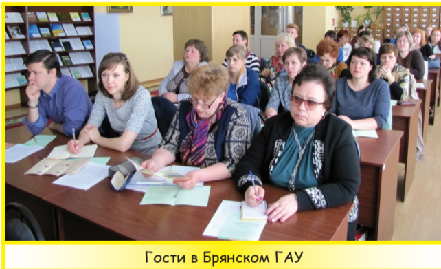
Гости в Брянском ГАУ