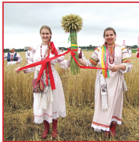
Пора же, мати, жито жати