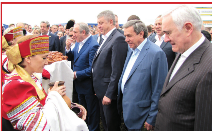
По русскому обычаю преподносится хлеб-соль дорогим гостям

Поле, русское поле... Светит луна или падает снег - Счастьем и болью связан с тобою, Нет, не забыть тебя сердцу вовек. Русское поле, русское поле... Сколько дорог прошагать мне пришлось! Ты - моя юность, ты - моя воля. То, что сбылось, то, что в жизни сбылось!