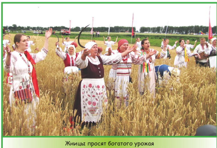
Жницы просят богатого урожая