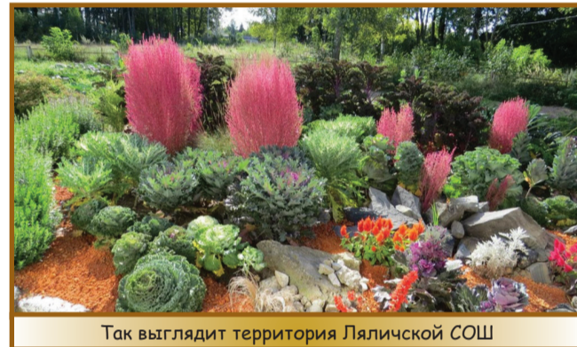
Так выглядит территория Ляличской СОШ