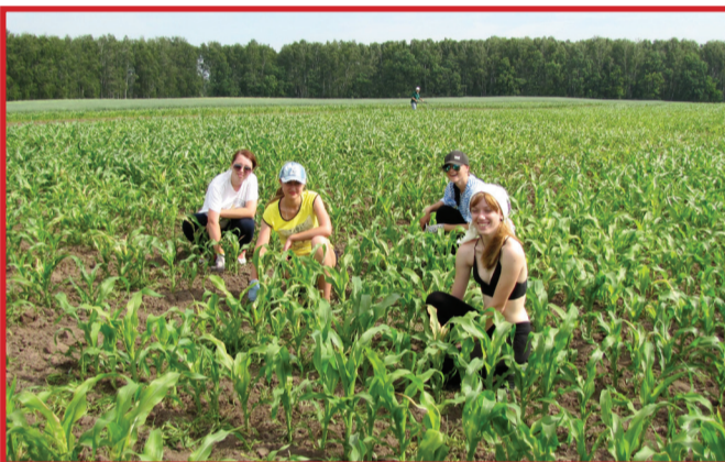
Студенты I курса института экономики и агробизнеса ухаживают за посевами кукурузы