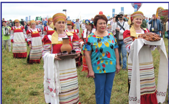
Выгоничский муниципальный район встречает дорогих гостей