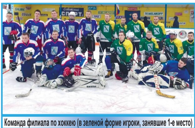
Команда филиала по хоккею (в зеленой форме игроки, занявшие 1-е место)