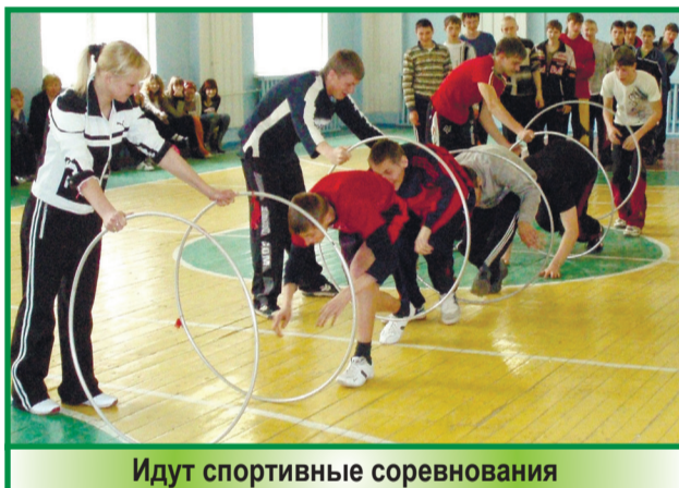
Идут спортивные соревнования

Главные творцы побед – это одаренные студенты и преданные своему делу педагоги Новозыбковского филиала Брянского ГАУ.