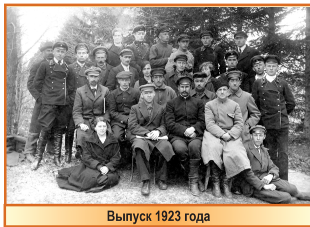
Выпуск 1923 года

Летом 1923 года техникум принял участие в первой Всероссийской сельскохозяйственной и промышленно-кустарной выставке в Москве,