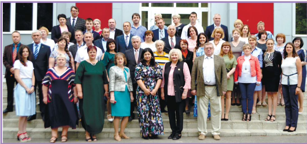
Коллектив техникума в год юбилея

Сегодня техникум продолжает динамично развиваться, это современное образовательное учреждение, где созданы условия для успешной работы и профессионального роста преподавательского состава; для учёбы, творческой деятельности, здорового образа жизни и отдыха студентов, где делается немало, чтобы привить обучающимся драгоценные качества специалиста, которые так необходимы для их профессиональной карьеры. Обслуживают учебный процесс в техникуме 81 штатный работник.