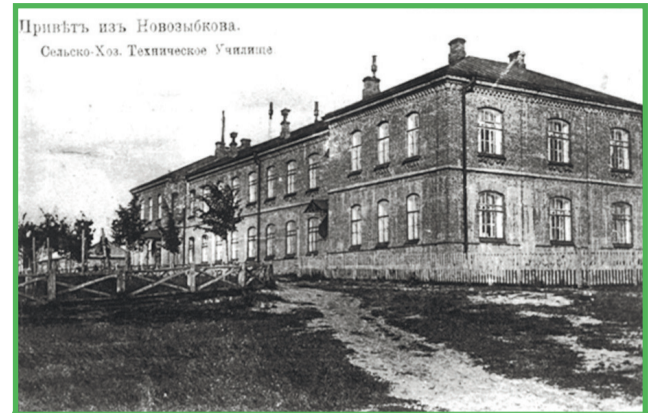
1905 г. Учебно-лабораторный корпус

в активную борьбу за возобновление его работы включились преподаватели, учащиеся и выпускники. Осенью 1932 года начал работать Новозыбковский сельскохозяйственный техникум полеводства. В довоенные годы техникум окончил 1088 человек. Коллектив техникума планировал выйти на новые, ещё более высокие рубежи, но наметенному не суждено было сбыться - началась Великая Отечественная война, которая круто изменила жизнь коллектива, нанесла учебному заведению, как и всей стране, огромный ущерб. В первые дни войны