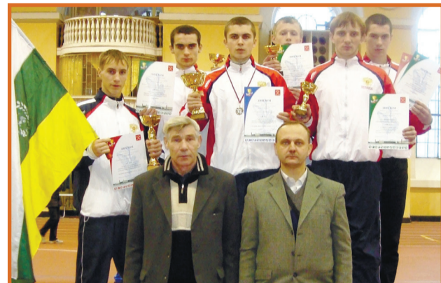
На Всероссийских соревнованиях в Санкт-Петербурге (2-е место)