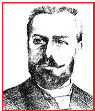
Николай Дмитриевич Долгоруков

1. Учредить с 1 июля 1899 года при Новозыбковском реальном училище среднее сельскохозяйственно-техническое училище на общих для промышленных училищ основаниях, закрыв с того же срока существующее при названном реальном училище коммерческое отделение; 2. Проект штата среднего сельскохозяйственно-технического училища при Новозыбковском реальном училище представить на Высочайшее Его Императорское Величество утверждение; 3. На содержание упомянутых учебных заведений ассигновать из Государственного Казначейства, сверх сумм, отпускаемых ныне на содержание Новозыбковского реального училища, в 1899 году, - десять тысяч