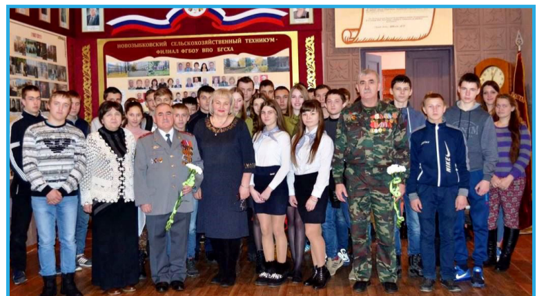
В историко-экологическом музее филиала