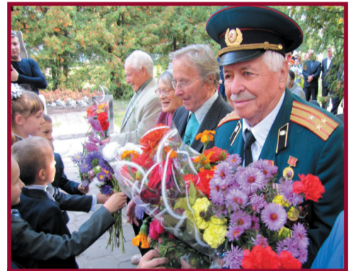
Учащиеся Кокинской школы дарят цветы дорогим ветеранам