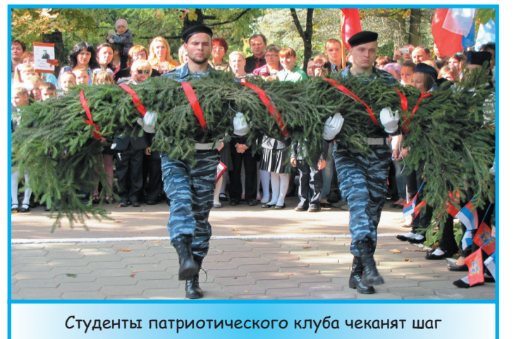
Студенты патристического клуба чеканят шаг