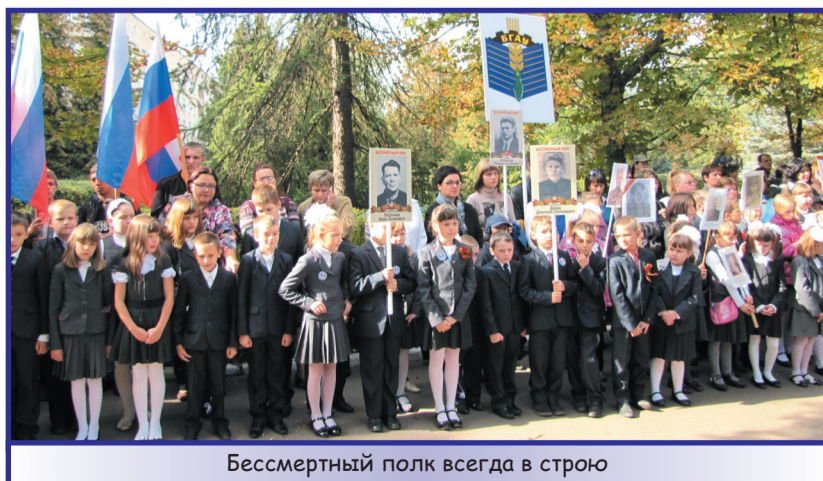
Бессмертный полк всегда в строю