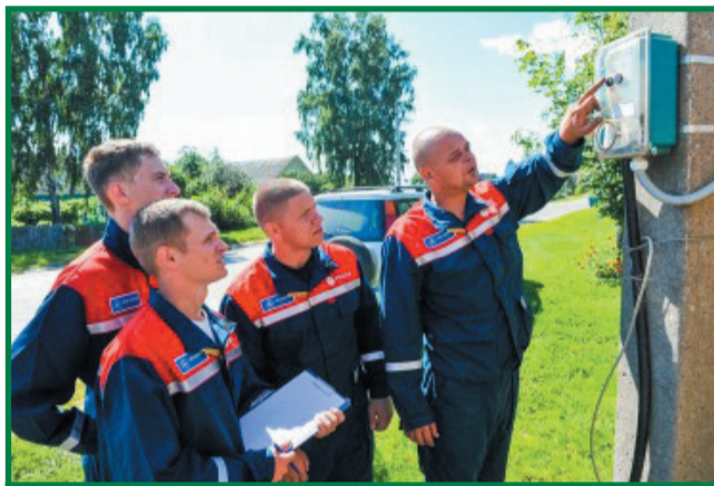
Снятие показаний приборов учёта

– Я считаю, - сказал он, - это очень ценное качество, которое поможет им успешно окончить университет, стать дипломированными энергетиками, а в будущем, и настоящими профессионалами своего дела.