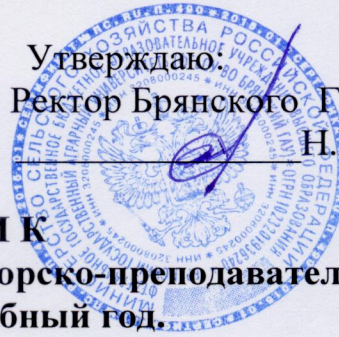
ГРАФИК избрания и проведения выборов профессорско-преподавательского состава на 2016-2017 учебный год.