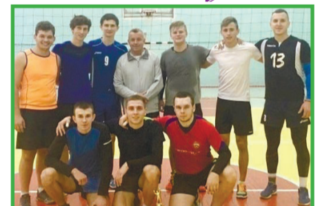
Студенческая волейбольная команда Брянского ГАУ - победитель турнира