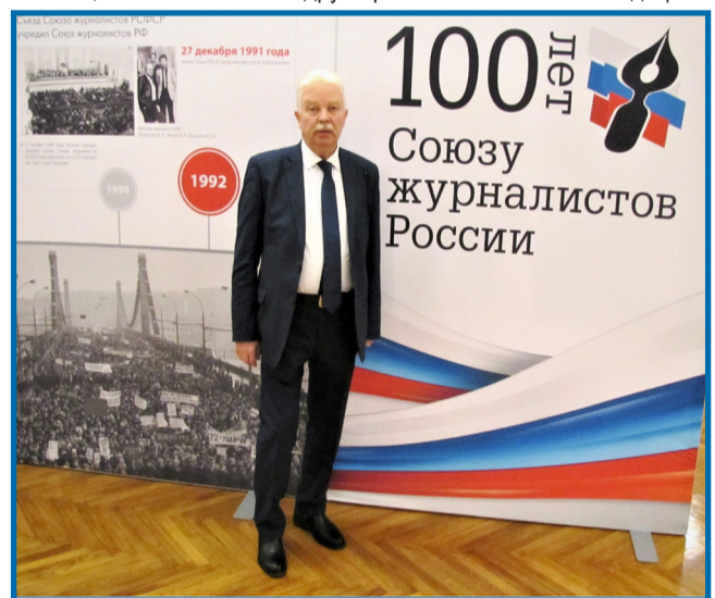
В театре Российской Армии проходила официальная часть мероприятия

Делегациям, прибывшим на 100-летие Союза журналистов России, в этот день была дана возможность посетить редакции центральных изданий страны, а также побывать на приёме в различных министерствах. Брянские журналисты посетили Министерство здравоохранения, где встретились с его руководителем Вероникой Скворцовой. Глава Минздрава в беседе с журналистами рассказала о нацпроектах, которые внедряются в стране. Были заданы вопросы, отражающие реальное положение медицины