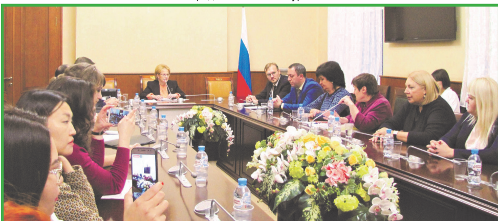
На встрече с министром здравоохранения России Вероникой Скворцовой